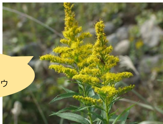
外来種！ セイタカアワダチソウ