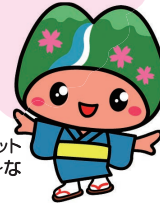
皆野町のマスコット み～な