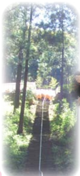
苔むした石段の上に 奥社 蓑山神社