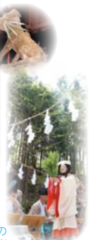
蓑山神社の 新緑の中の神楽