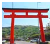
棕神社の大鳥居越しに、 美の山の蓑山神社の森が見える

皆野町大浜の皆野棕神社の大鳥居から望む美の山に、奥社 蓑山神社が鎮座。毎年五月三日はこの奥社の八十八夜祭です。朝から祭典を行い、奥社神前の新緑の中での神楽奉納や、伝統芸能の後継者認定証の授与と式も。昼は遊歩道を御旅所の山頂広場までの御神幸行列が道中太鼓でにぎやかに。午後は山頂広場の御旅所での祭典に続き、神楽や皆野のさまざまなお囃子、秩父音頭の奉納が三時頃まで続きます。