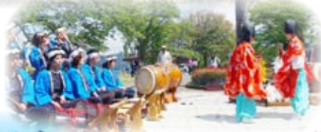
山頂広場で 神楽やお囃子