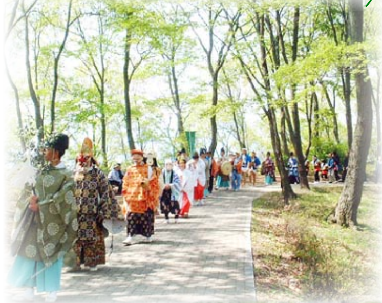
遊歩道を御神幸行列