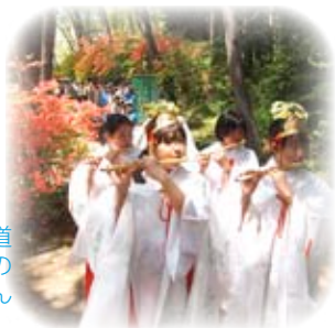
つつじの遊歩道 御神幸行列の 可愛い巫女さん